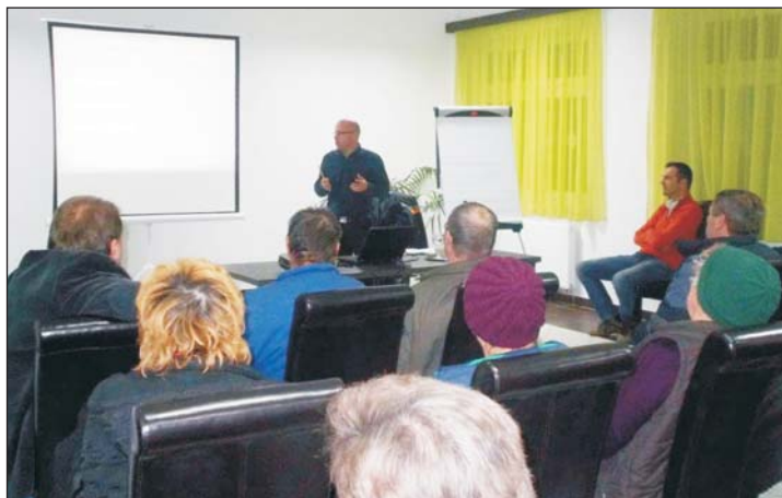
Először az elméleti ismeretek bővültek.

A tavasz beköszöntével időszerűvé vált a gyümölcsfák ápolása, metszése is. Ennek apropóján tartottak gyümölcsstermesztési és növényvédelmi előadást Semjénházán.