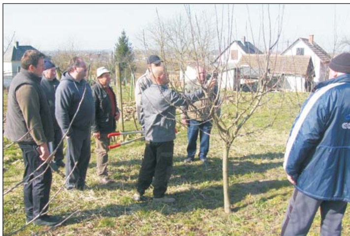
Aztán gyakorlati bemutatóra került sor.